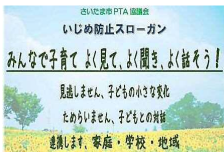
平成27年度「いじめ防止シンポジウム」発表

わたしたちのノー！ 一、わたしたちは、暴力やいじりな ど、人の嫌がることをしません。 一、わたしたちは、SOSを見て見 ぬふりをしません。 わたしたちのイエス！ 一、わたしたちは、「うれしいこと」を 相手にします。 一、わたしたちは、大人、先生、友 だちに相談します。